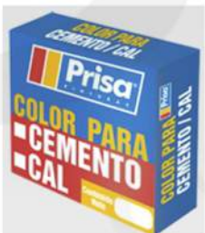
Color para cemento