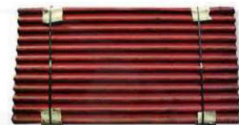
Lámina de Cartón